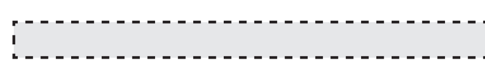
Crystal L oboustranné