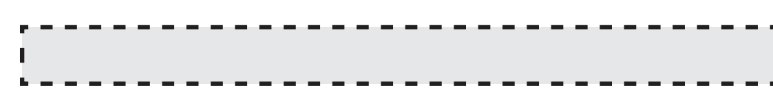
Surfer XL oboustranné